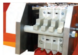
Kammerfilterpresse mit Luftkissen