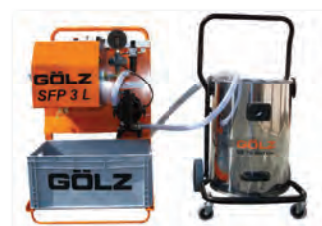
Schlammflux mit Nassauger