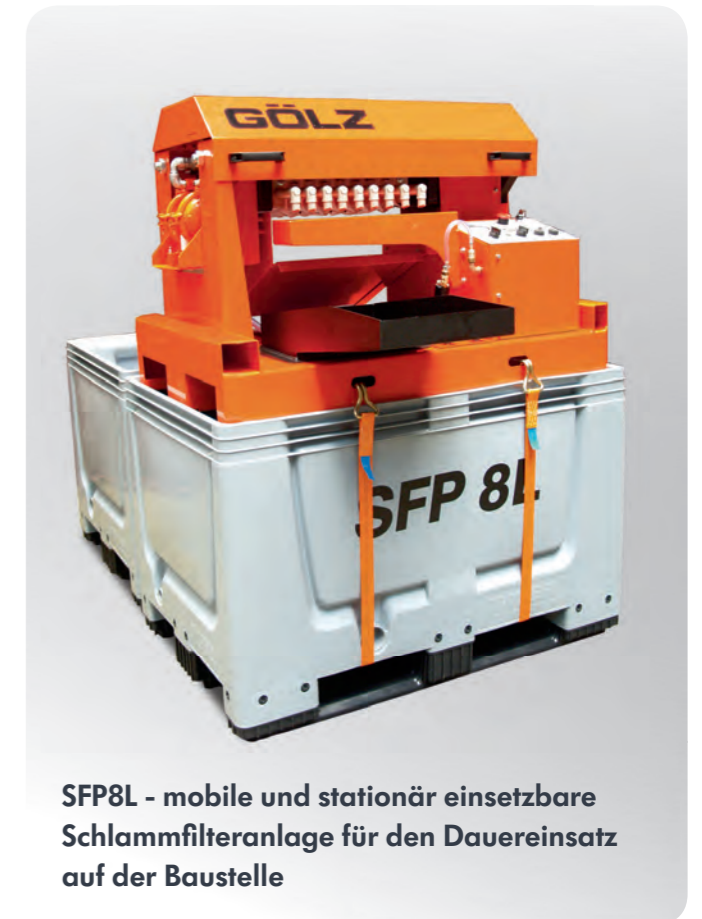
SFP8L - mobile und stationär einsetzbare Schlammfilteranlage für den Dauereinsatz auf der Baustelle