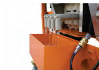
Filterausgang mit Ablaufrinne