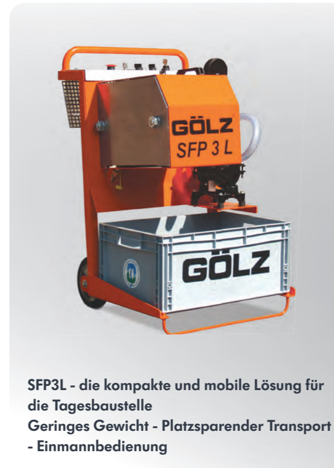
SFP3L - die kompakte und mobile Lösung für die Tagesbaustelle Geringes Gewicht - Platzsparender Transport - Einmannbedienung