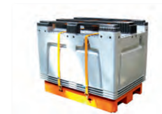
Schlammbox kann als Abdeckung genutzt werden

GÖLZ Schlammflux - die effektive Lösung für die einfache Schlammabeseitigung!