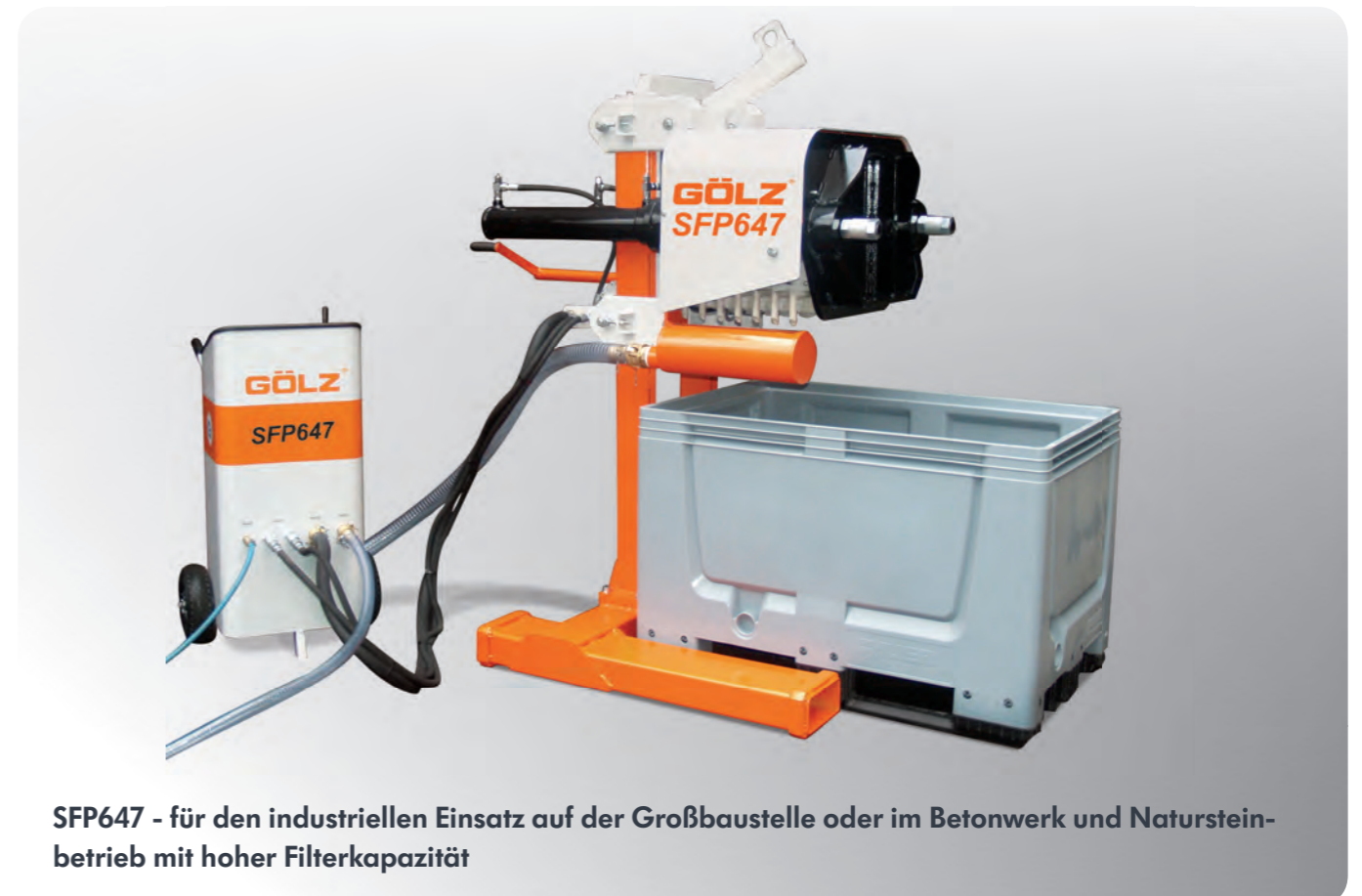
SFP647 - für den industriellen Einsatz auf der Großbaustelle oder im Betonwerk und Natursteinbetrieb mit hoher Filterkapazität