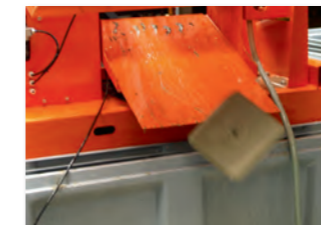
Filterkuchen fallen in Sammelbehälter