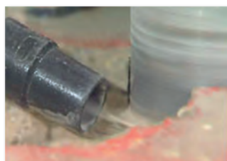
Absaugen des Bohrschlamm