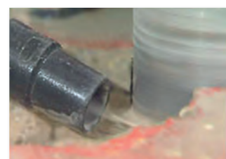
Absaugen des Bohrschlammes