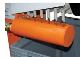
Filterausgang mit Ablaufrinne