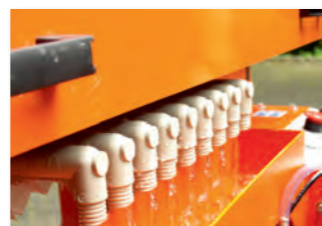
Filterausgang mit Ablaufrinne

Der SFP8L -Schlammflux ist die ökonomische Lösung für die Entsorgung von Beton- und Schneidschlamm. Alle Bedieneinheiten sind Druckluft gesteuert und benötigen zum Antrieb nur einen 230 V Kompressor. Die Einheit besteht aus vier Grundkomponenten: Dem Auffangbehälter/Schlammbecken, der Kammerfilterpresse, der Bedieneinheit und einem 230 V Luftkompressor. Durch seine platzsparenden Abmessungen kann der SFP8L an sämtlichen Arbeitsplätzen eingesetzt werden.