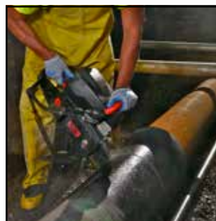
Sicherer für Schnitt von duktilen Gussrohren