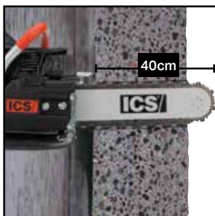
Tiefe Schnitte für schwer zugängliche oder schmale Öffnungen