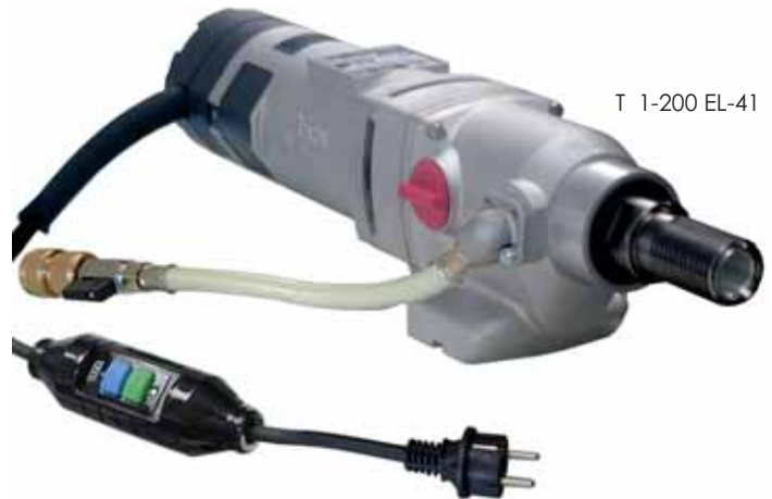
T 1-200 EL-41