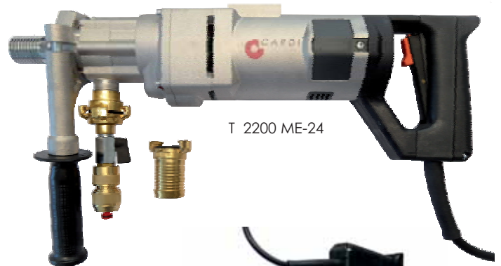
T 2200 ME-24

Alle angegebenen Preise sind UVP, ohne MWST und Versandkosten. Technische Änderungen vorbehalten.