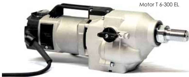
Motor T 6-300 EL